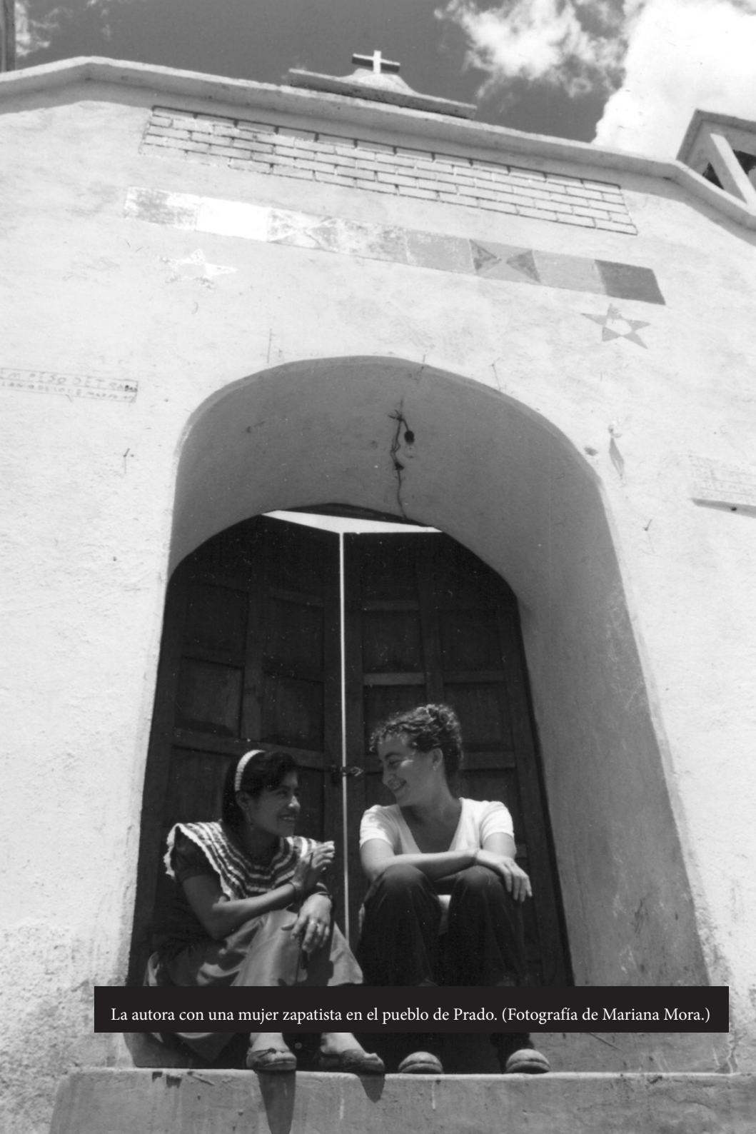
La autora con una mujer zapatista en el pueblo de Prado.