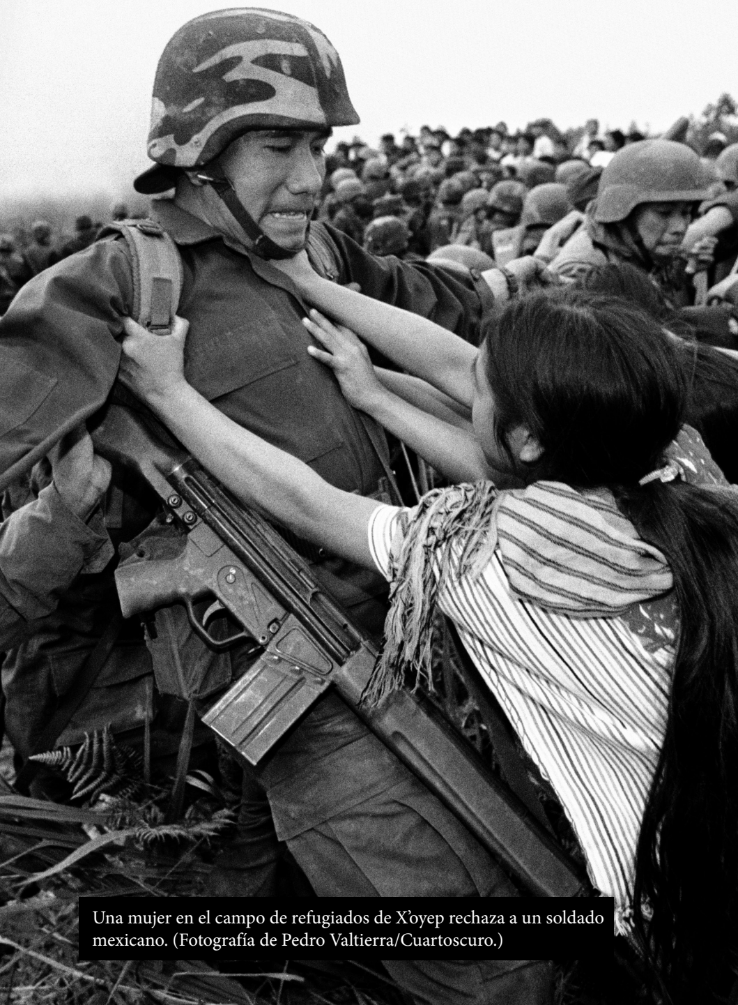
Una mujer en el campo de refugiados de X'oyep rechaza a un soldado mexicano.