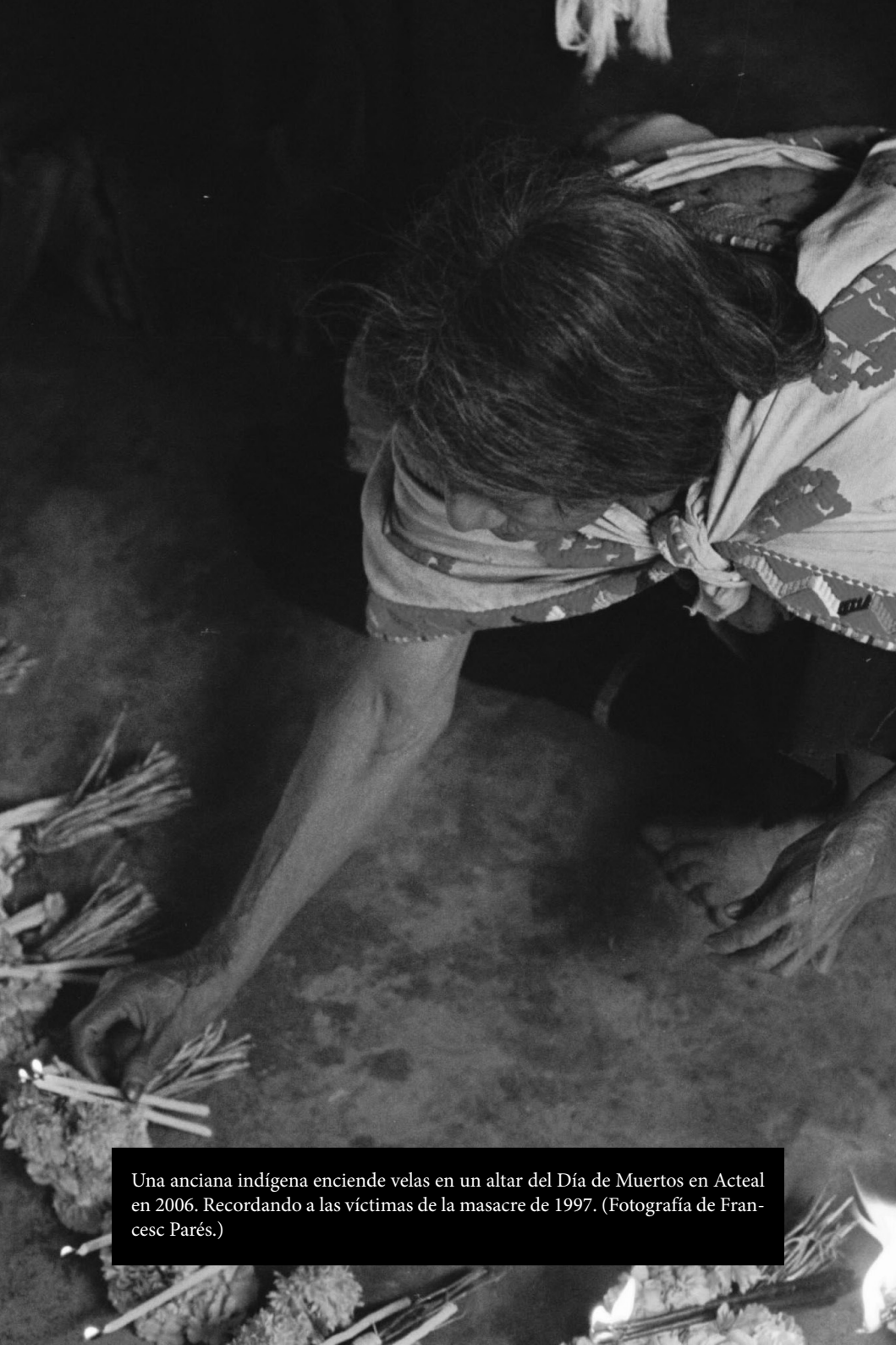
Una anciana indígena enciende velas en un altar del Día de Muertos en Acteal en 2006. Recordando a las víctimas de la masacre de 1997.