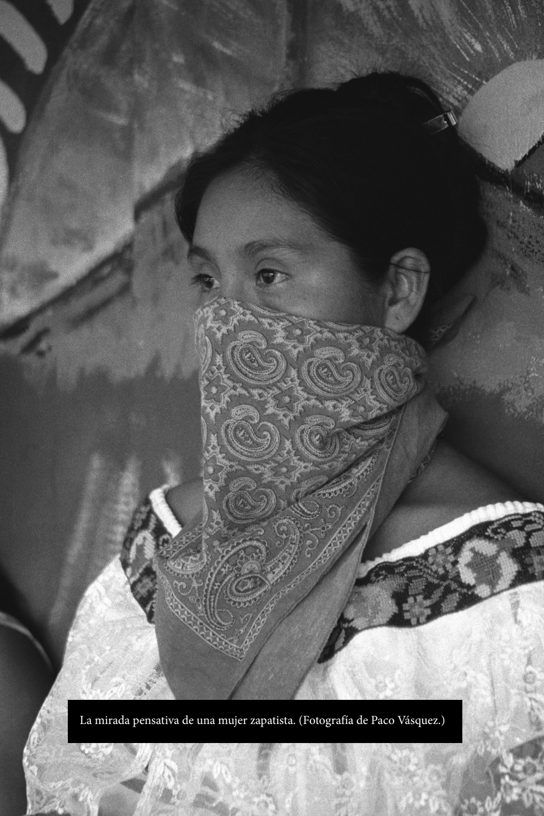
La mirada pensativa de una mujer zapatista.