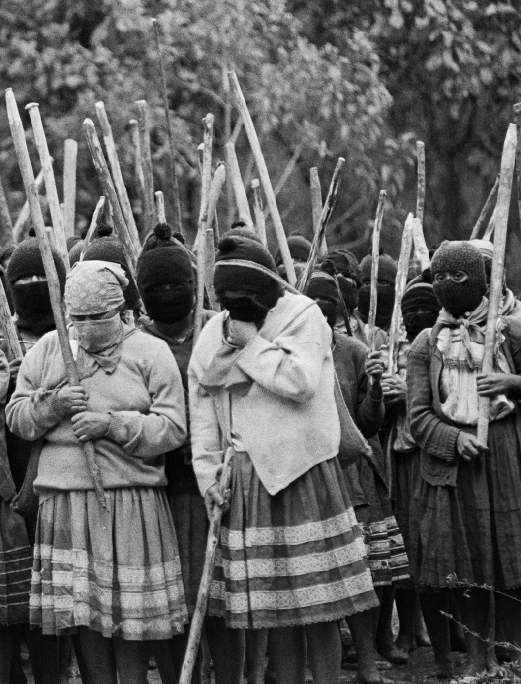
Mujeres zapatistas de Yakchpic se preparan para proteger a su comunidad de un Ataque del ejército mexicano.