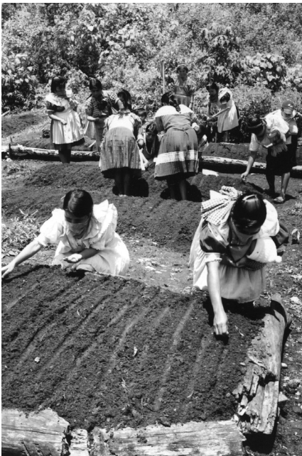
Huerto colectivo en Ocho de Marzo.

Cuando nosotras salimos a una reunión traemos esa palabra otra vez a la comunidad y todos [se] benefician de ese conocimiento, de esas ideas. Así como nosotras las coordinadoras, no es beneficio personal. Tenemos que aprender un poco, perder la pena un poco para poder apoyar al pueblo. 216