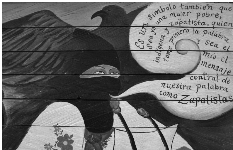
Mural en el municipio autónomo Lucio Cabañas que representa a la Comandanta Ester y sus palabras ante el Congreso mexicano en marzo de 2001.

este de San Cristóbal. “Ella es una de nosotras —decían las mujeres de las comunidades zapatistas, que se miraban y remarcaban— y ahí está ella, ¡hablando ante el Congreso!”