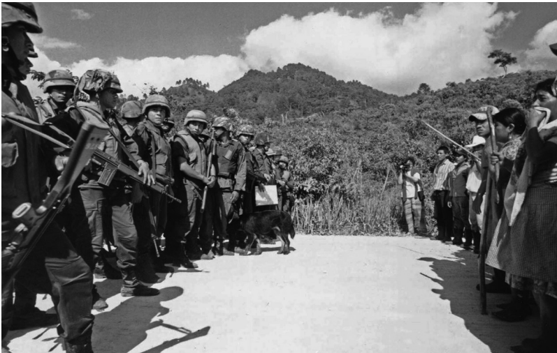
Zapatistas del pueblo de Galeana se enfrentan a soldados mexicanos

En una aldea, uno de los hombres, representante local, se había empeñado en prohibir a su mujer que ejerciera cualquier cargo de responsabilidad pública. Varias veces las mujeres la habían propuesto como coordinadora de la tienda cooperativa que manejaban, pero su respuesta siempre era “Mi marido no me deja”. Semejante actitud incidía en la comunidad entera, ya que el marido tenía un cargo de liderazgo y era visto como ejemplo a seguir. Una vez que su esposa y las demás mujeres de su aldea se movilizaron para correr a los soldados de su comunidad, ya no podía interponerse. Ésta comentó que la actitud de su esposo se había modificado y que ella había seguido insistiendo en su derecho a participar en actividades fuera del hogar. Poco después fue nombrada como una de las coordinadoras de la cooperativa de mujeres. Algunos meses más adelante, el número de mujeres que asistían y tomaban la palabra en las asambleas comunitarias empezó a repuntar, lenta pero perceptiblemente.