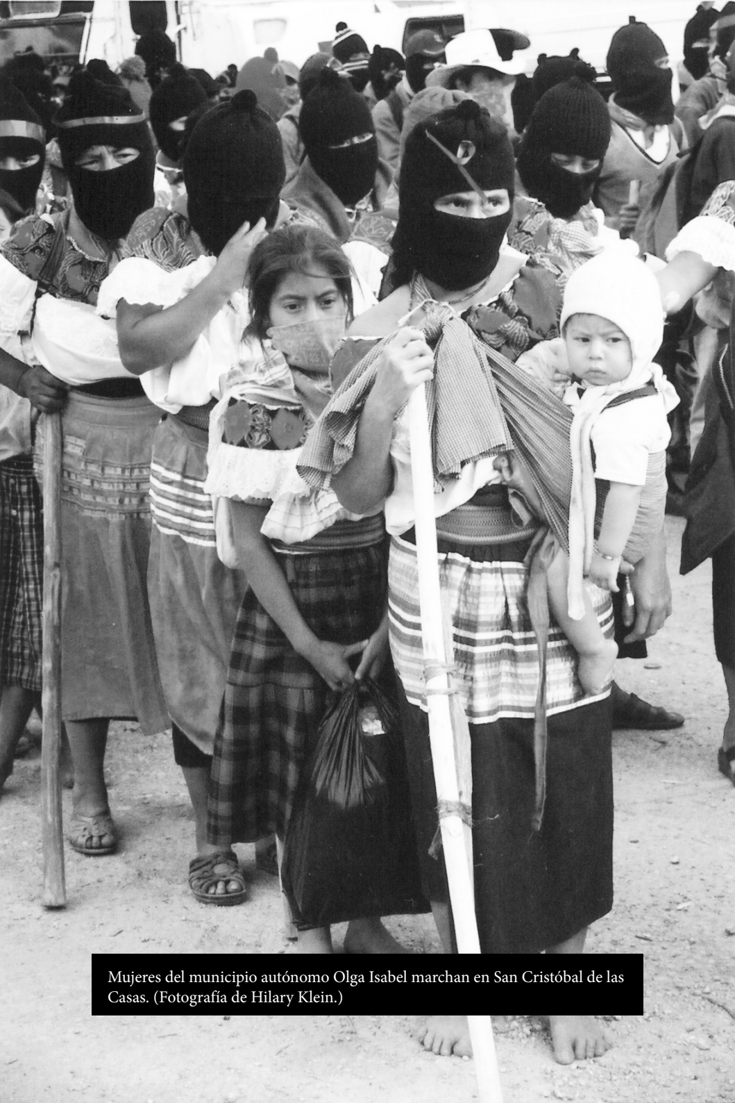
Mujeres del municipio autónomo Olga Isabel marchan en San Cristóbal de las Casas.