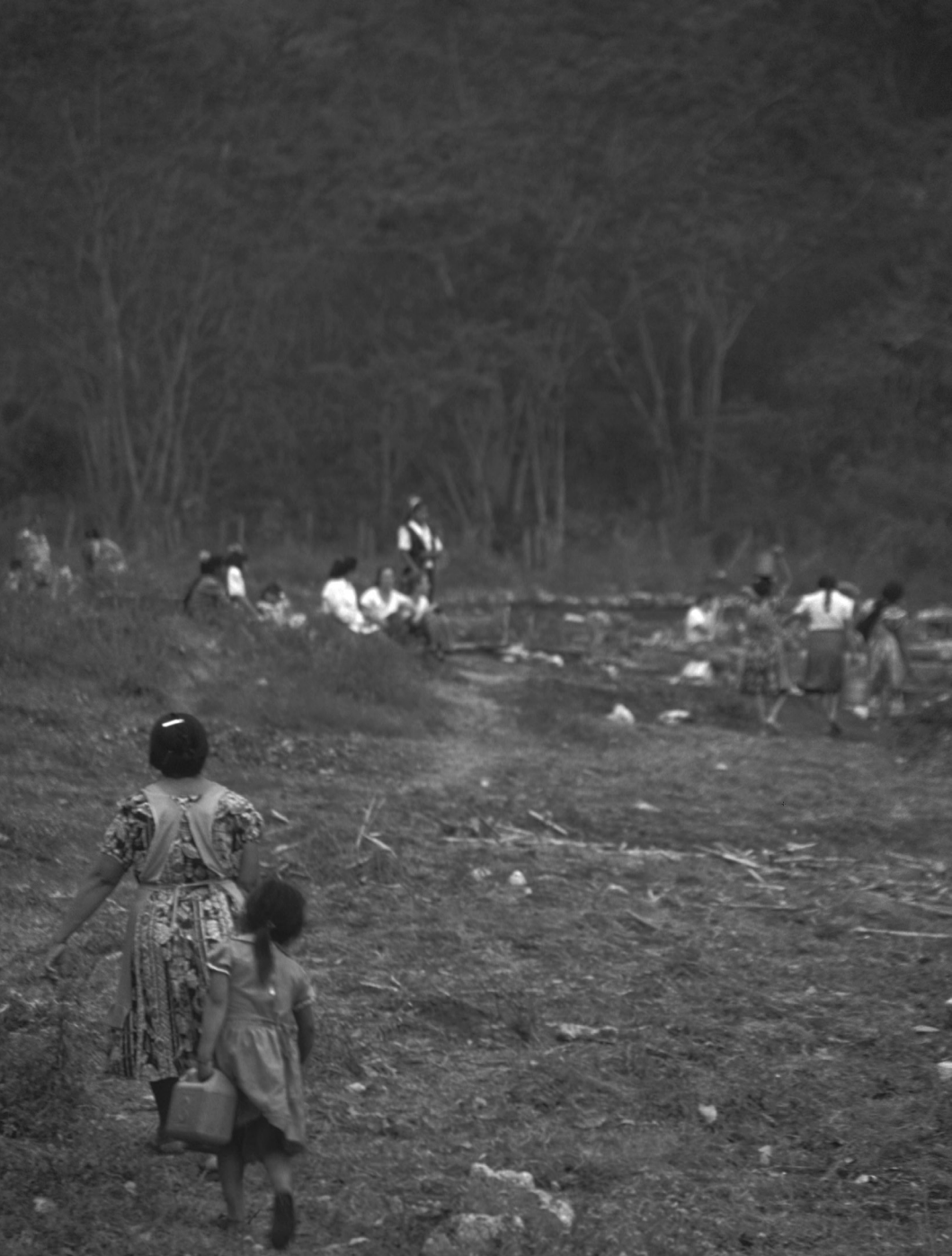
Mujeres cuidan un huerto cooperativo en Morelia.