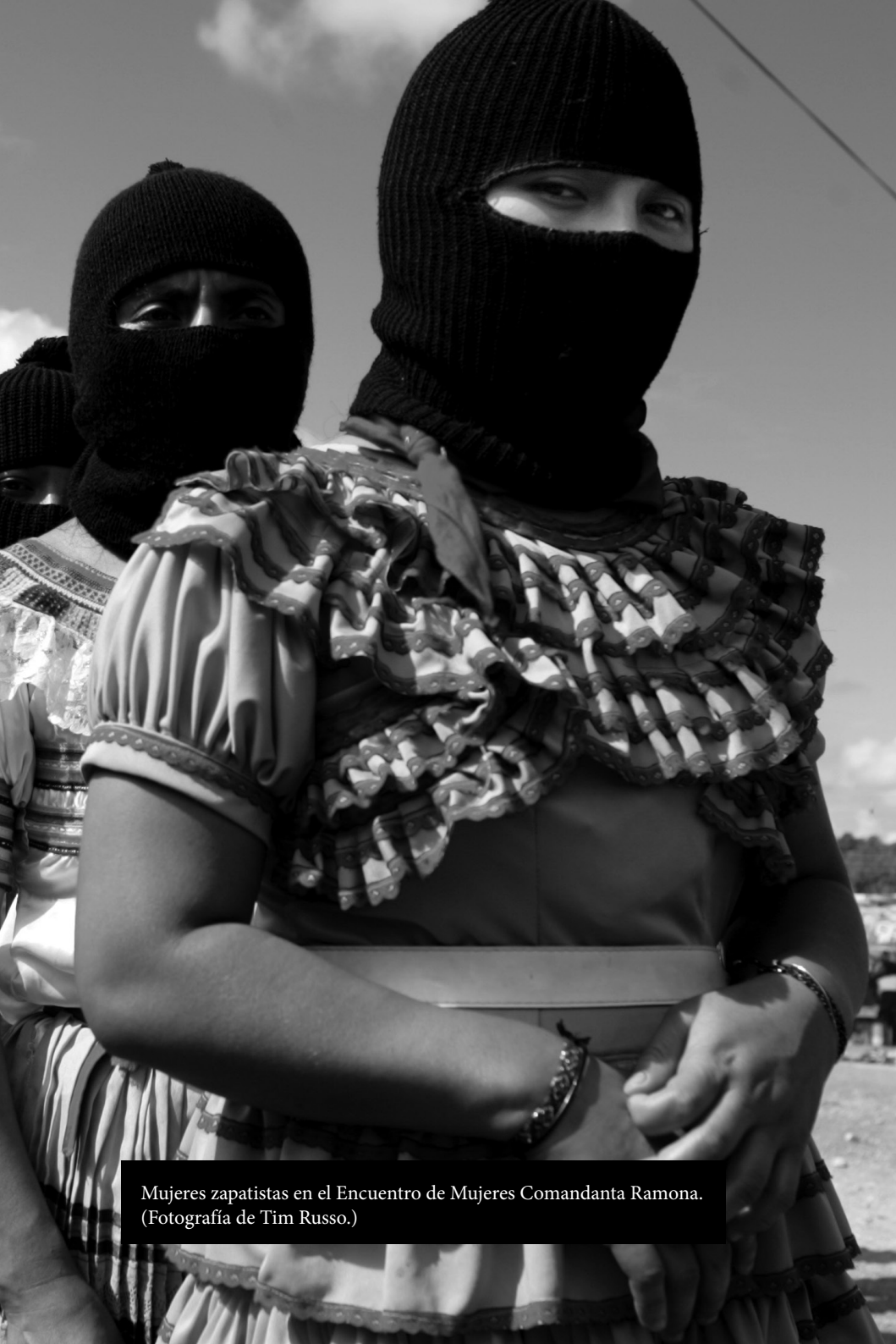
Mujeres zapatistas en el Encuentro de Mujeres Comandanta Ramona.