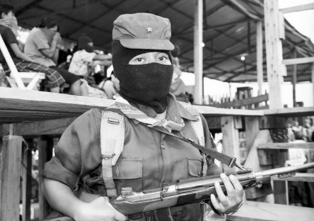
Una insurgente zapatista hace guardia en una reunión en La Realidad en 1999.

Lo que hacen los hombres hacemos las mujeres. Lo mismo, aprender tácticas de combate, hacer trabajo político en las poblaciones. En nuestra organización existe el respeto, sobre todo entre los combatientes. Todavía en las comunidades existe esa ideología y se da el maltrato, pero en nuestras filas existe mucha igualdad. El trabajo que hace el hombre puede hacerlo la mujer, el estudio que reciben es igual, el grado o responsabilidad que puedan alcanzar también. Por ejemplo yo tengo el grado de mayor insurgente de infantería. Mando un batallón de combatientes, los dirijo en la lucha, en los combates, y sé que puedo mover a esa gente. 57